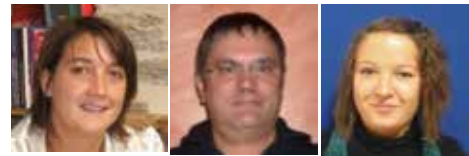
L'équipe du LAEP

Deux temps d'accueil : les mardis de 15h45 à 18h45 et les mercredis de 9h à 11h.