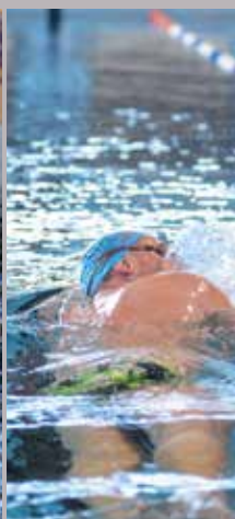
Bassin Inox, 6 couleurs de nage