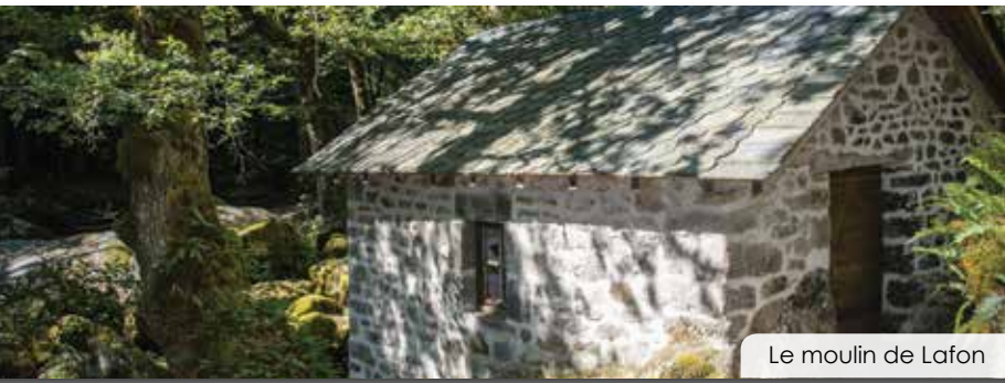
Le moulin de Lafon