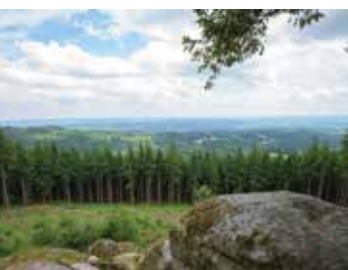
Panorama du Puy de la Tourte