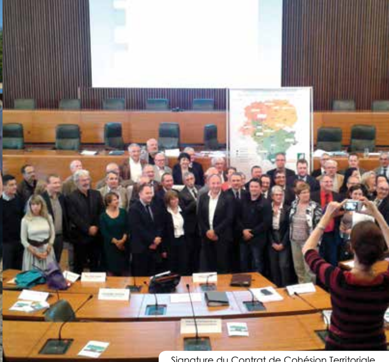
Signature du Contrat de Cohésion Territoriale