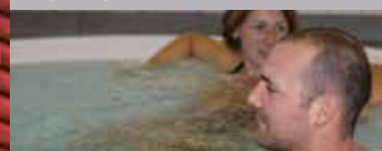
Jacuzzi - Douches massantes

Centre Aquarécricatif - Boulevard Puy Nègre - 19300 Egletons - Tél. : 05 55 93 93 90