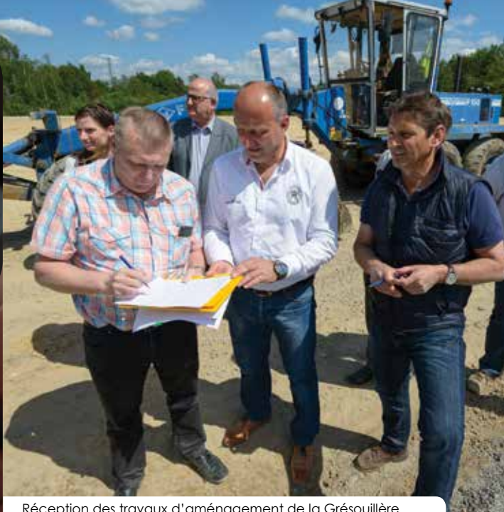
Réception des travaux d'aménagement de la Grésouillère