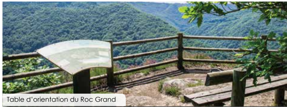
Table d'orientation du Roc Grand

Nombre d'habitants : 192 Téléphone mairie : 05 55 27 83 70 mairie.saintmerddelapleau@wanadoo.fr