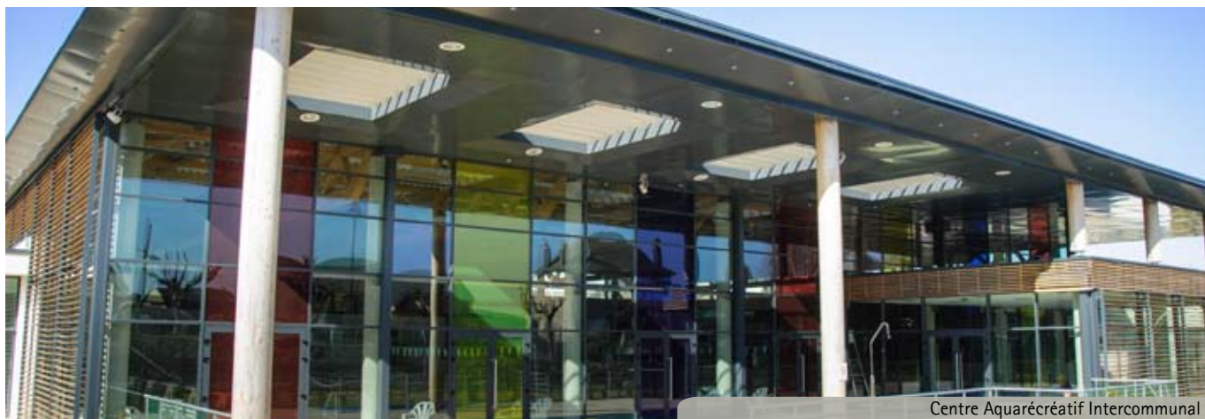
Centre Aquarécréatif Intercommunal