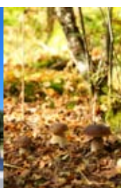
Sur les chemins...