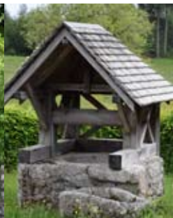
Puit au Montusclat