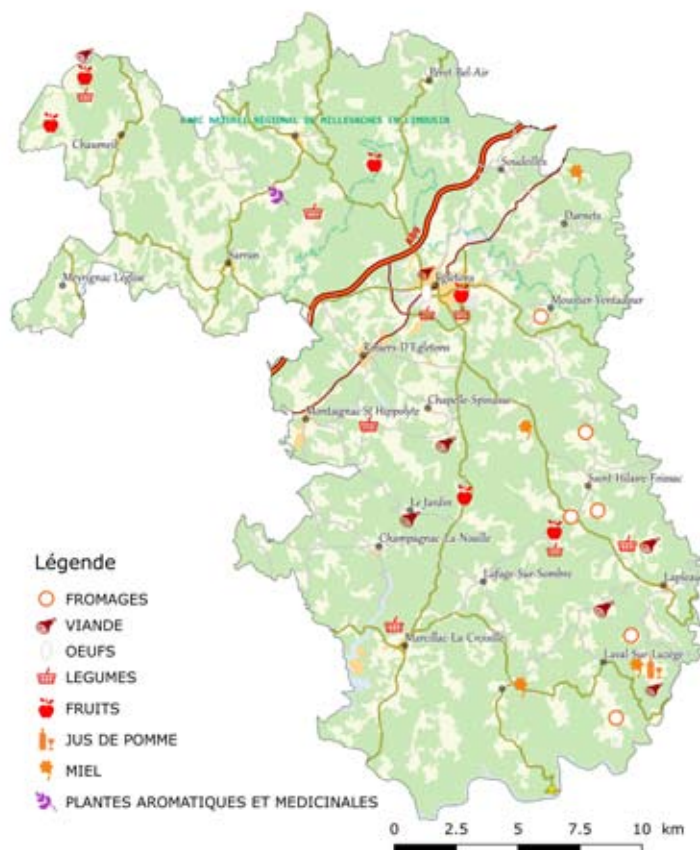
PRODUCTEURS LOCAUX ET VENTE A LA FERME

La liste complète ainsi que les coordonnées des lieux de vente sont disponibles sur notre site internet www.cc-ventadour.fr