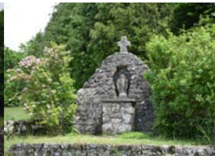
Notre Dame du Peuch