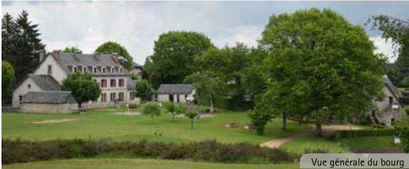
Vue générale du bourg