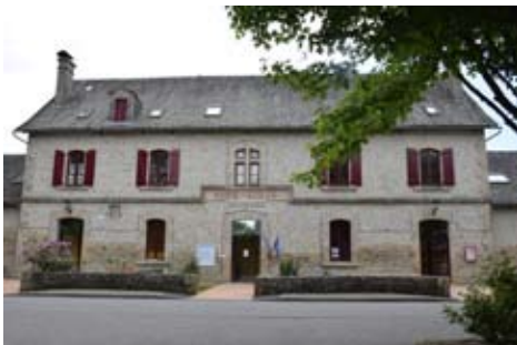
Mairie - école