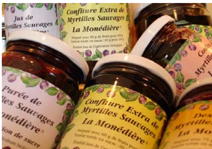
Producteurs locaux sur la Communauté de Communes